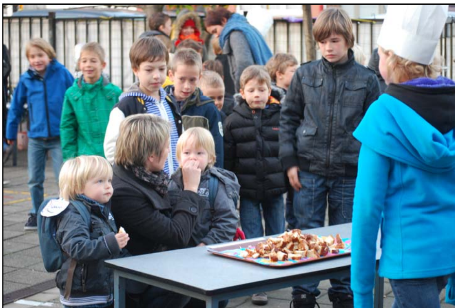
Foto links: "Dag van het brood". Het was een supertoffe opener van de dag!